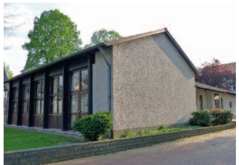
Die Arche in Hemmerde.

Schon vor fünf Jahren hat es dazu erste Gemeindeversammlungen gegeben, in denen die unausweichliche Schließung von Häusern angekündigt wurde. Es gab engagierte Diskussionen, aber es wurde auch klar, dass die Gemeindeglieder nicht zusätzlich zur Kasse gebeten werden wollten, um die Schließung der Häuser dann evtl. doch nur