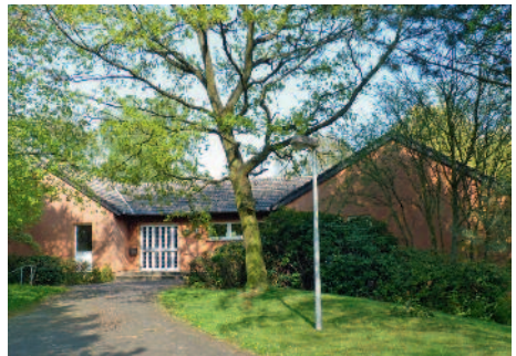
Das Philipp-Nicolai-Haus in Mühlhausen/Uelzen.

Haus liegt mitten in der Gemeinde, wohl nicht das schönste der drei Häuser, aber zur Zeit doch am intensivsten genutzt.