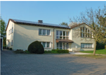
Das Ludwig-Polscher-Haus in Lünern.

Vielleicht eröffnet uns die Notwendigkeit aber auch den Blick auf neue Möglichkeiten. Neue Kooperationspartner und neue Ideen tauchen auf. Es wird viel daran liegen, die Trennung von Häusern nicht als Niederlage, sondern als wichtigen Schritt zur Sicherung der Zukunftsperspektive unserer Gemeinde zu begreifen. Wir tun jetzt einen Schritt, der schmerzhaft ist und sicherlich auch manchen Abschied von lieb Gewonnenem bedeuten wird. Aber damit entstehen auch wieder neue Handlungs- und „Spiel“räume. Die gilt es mit Vertrauen und neuer Leidenschaft zu nutzen.