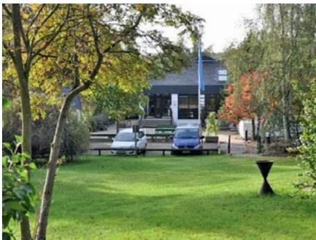
Haus in Malente

Ein Beispiel aus der Vergangenheit: Zwei Männer sitzen 1940 in einem deutschen Gartenlokal vor einem Rundfunksender. Der Radiosprecher berichtet vom Sieg der deutschen Truppen über Frankreich und alle stehen auf zum Hitlergruß, bis auf einer der beiden Männer. Der eine Mann stürzt zu ihm und hebt den Arm des Freundes abrupt in die Luft und zischt ihm zu: „Wir werden uns jetzt für ganz andere Dinge gefährden müssen, aber nicht für diesen Salut“. Das war Dietrich Bonhoeffer, der sich in die Politik einmischte.