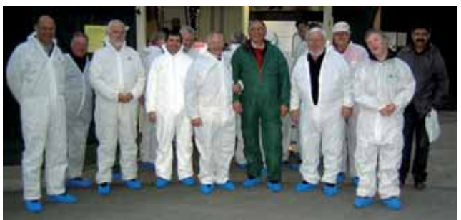
▲ Vorher – nachher: die Mitglieder des Männerforums bei der Hofbesichtigung.