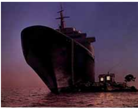
Vilket kaffe skulle du bjuda på om du fick oväntat besök?

„...när du får oväntat besök“ heißt der Slogan eines schwedischen Kaffeeherstellers. „Wenn du unerwartet Besuch bekommst“ heißt das und der Kaffee des Herstellers ist das passende Mittel zum Anlass: Eine Tasse Kaffee und der Besuch kann kommen. In Schweden ist das recht populär, bei allen Gelegenheiten Kaffee miteinander zu trinken. „Ska du ha en kopp?“ „Willst du eine Tasse?“, ist der Anfang vieler Gespräche.